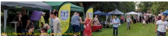
Impressionen von 2024

Gemeinsam mit der Sozialraumkoordinatorin und dem Runden Tisch Holweide lädt das Team des Cassiopeia Theaters ein, sich auf einem Markt der Möglichkeiten über die Angebote von fast 30 sozialen Einrichtungen im Stadtteil zu informieren.