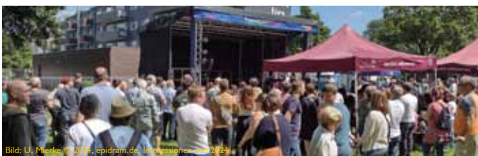
Impressionen von 2024

Gemeinsam mit der Sozialraumkoordinatorin und dem Runden Tisch Holweide lädt das Team des Cassiopeia Theaters ein, sich auf einem Markt der Möglichkeiten über die Angebote von fast 30 sozialen Einrichtungen im Stadtteil zu informieren.