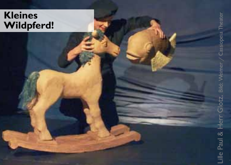
Lille Paul & Herr Glotz, Bild: Weimer / Cassiopeia Theater