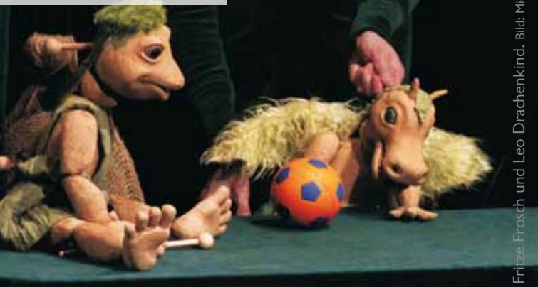
Fritze Frosch und Leo Drachenkind.