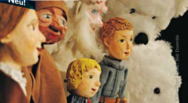
Väterchen Frost