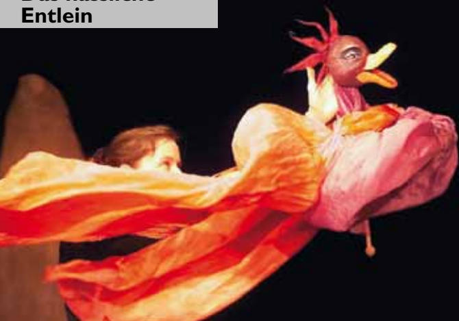
Die Lächerente. Bild: Weimer / Cassiopeia Theater